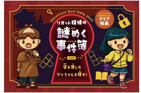
「Adventure Quiz Rally 2025 Spring!」 イベント イメージ

クイズシートに書かれた問題をスマートフォンの LINE アプリを活用して回答しながら、ホテル館内の手がかりを収集し謎を解いていく、お子さまを中心にご家族で楽しめる謎解きクイズラリーです。見事謎を解き明かした挑戦者はクリア特典としてホテルオリジナルのクリアカードと滋賀県ご当地グッズ、プラネタリウムと屋内プールがそれぞれ 500 円で利用できる優待券と、小学生以下のお子様にはレストランで利用できる特典もプレゼント。ストーリーを新たにリニューアルした当イベントを体験し、冒険のひとつときをお過ごしください。