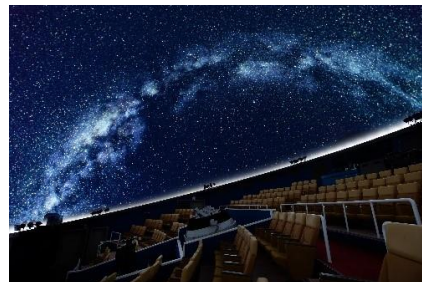
プラネタリウム イメージ

URL: https://www.biwako-marriott.com/hotaru/program.html