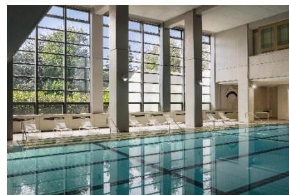
屋内プール イメージ