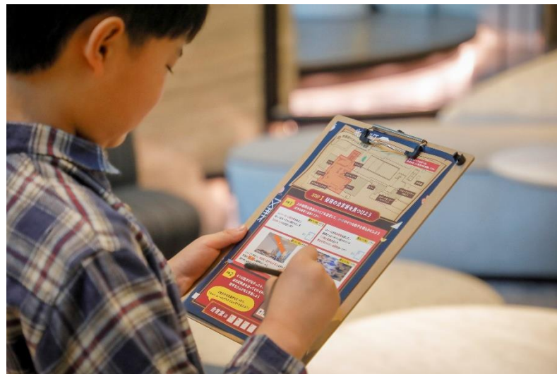
「Adventure Quiz Rally 2025 Spring!」イメージ

ホテルに隠された謎を解き明かすワクワクの体験を楽しむイベント アドベンチャー クイズ ラリー スプリング 「 Adventure Quiz Rally 2025 Spring! 」を開催 期間：2025年3月21日(金)～6月30日(月)